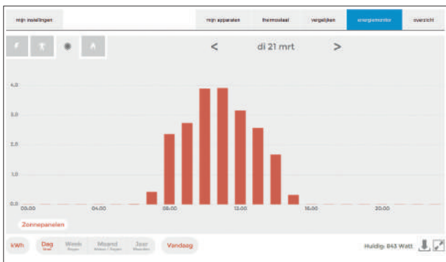
Energieopwekking met zonnepanelen

Via een monitoringsysteem volgt het Groene Scholen Collectief alle energiestromen.